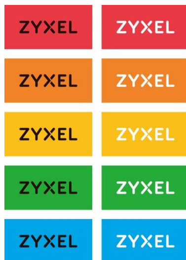
Une palette de cinq couleurs