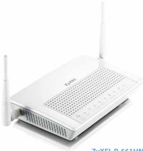
ZyXEL P-661HNU Référence : ZY-P661HNU Prix public : 360 EUR HT