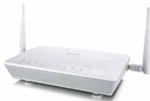
ZyXEL P-661HNU Référence : ZY-P661HNU Langues : Fr/All/Ang/It Prix public : 360 EUR HT

Une interface de gestion simple Afin d'éviter aux installateurs de consacrer un temps trop important au paramétrage, l'interface de gestion multilingue a été simplifiée. De plus, le P-661HNU supporte le protocole TR-069 permettant aux opérateurs de le configurer à distance sans intervention de l'utilisateur. Ce protocole permet de faciliter les déploiements et donc de réduire considérablement les coûts de maintenance.