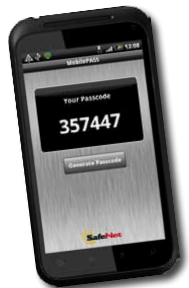
ZyXEL OTPv2 Référence : ZY-OTPv2

MobilePass est compatible avec les marques références du marché telles qu'iPhone, Android, BlackBerry, Windows Mobile et Windows Desktop. Le logiciel supporte également la fonction VPN et les applications Web comme l'e-banking, les services dans les domaines de l'éducation et de la santé ainsi que d'autres services en ligne.