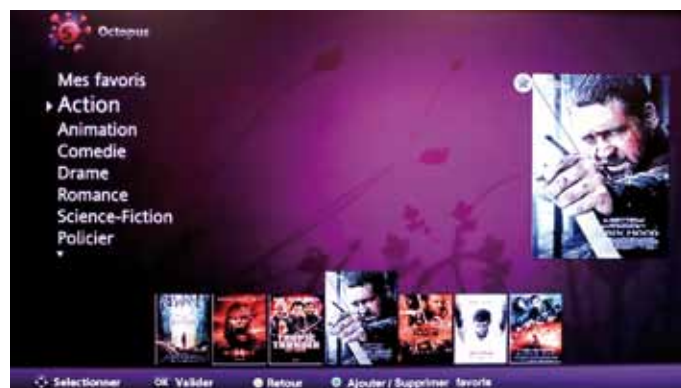
24 films du box office qui se renouvellent selon l'actualité