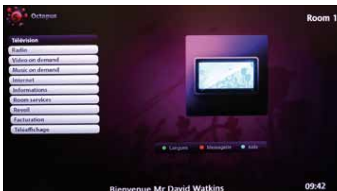
Le menu principal personnalisable donne accès aux différentes rubriques

Tous les achats effectués via Octopus sont comptabilisés et visibles sur l'interface, pour que le client connaisse à tout moment ses dépenses engagées.