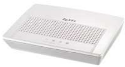
ZyXEL P-870M (Réf. : ZY-P870M) - Modem VDSL pour connexions point à point